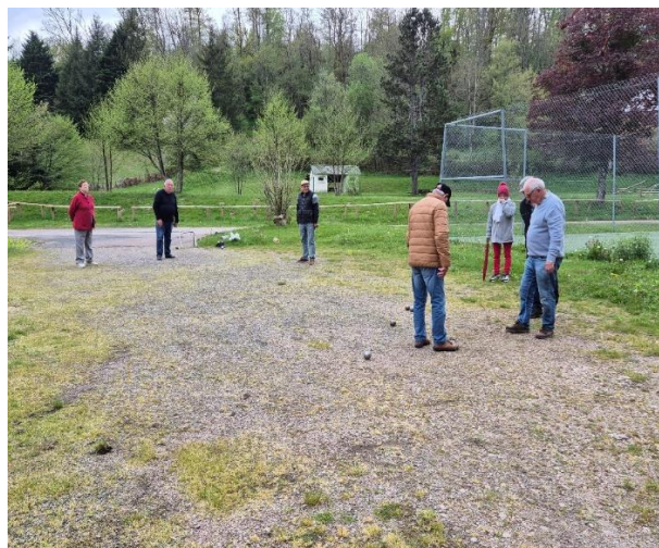
Tu pointes où tu tires ?