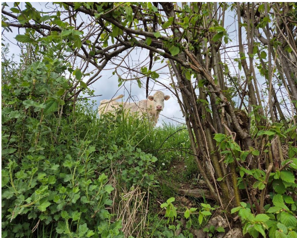
Une curieuse !!

*Samedi 26, une promenade pédestre autour du village d'Anost était proposée, en compagnie de l'ancien maire d'Anost et d'une guide. Elle a mené les marcheurs le long de jolis sentiers fleuris et ce jusqu'au village (découverte de l'église et de ses gisants). Le soir un repas a rassemblé tout le monde à la salle des fêtes animé par DJ Christian et son karaoké.